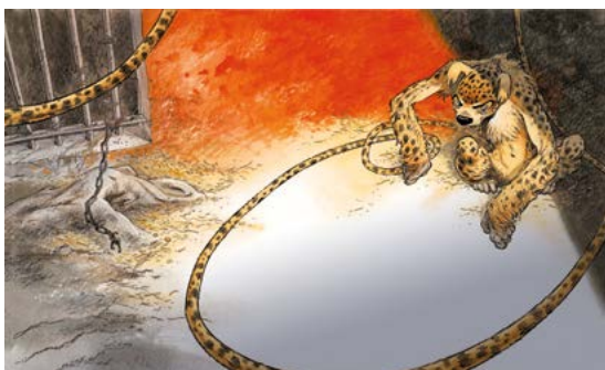
Dessin de couverture La Bête , tome 1, 2020 - © Frank/Dupuis.

Par-delà les bêtes, l'œuvre de Frank Pé nous questionne régulièrement sur la brûlante relation entre l'Homme et l'Animal, qui commence toujours ici par une fascination.