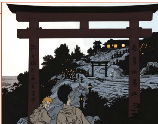
Broussaille au Japon.