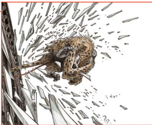
Marsupilami super-héros. © Frank/Dupuis

Ouverture tardive de l'exposition jusqu'à 18h30. Auditorium . 5€ / gratuit pour les étudiants